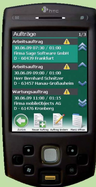
Endgerät für mobilen Kundenservice HTC P6500

Das Zusatzmodul mO – mobiler Kundenservice ermöglicht Ihnen und Ihren Mitarbeitern mit Hilfe spezieller Handys auch unterwegs auf Stammdaten und Aufträge im HWP zuzugreifen. Die Mitarbeiter können optimal gesteuert werden und sich per Navigationssoftware zum Kunden leiten lassen. Arbeiten lassen sich vor Ort dokumentieren, vom Kunden abzeichnen und per Knopfdruck an die Zentrale weiter leiten zwecks Rechnungsstellung.